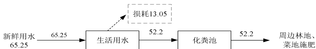
图 5-2 水平衡图 (最大用水量, 单位: m 3 /a)

项目职工 3 人，提供食宿，年工作 150 天。按照《湖南省用水定额》(DB43/T388-2014) 中的指标计算，用水量按 145L/d·人计，则本项目生活用水量为 0.435m 3 /d (65.25m 3 /a)，污水排放系数取 0.8，则生活污水排放量约为 0.348m 3 /d (52.2m 3 /a)。生活污水经化粪池处理后，用于周边菜地施肥，不外排。