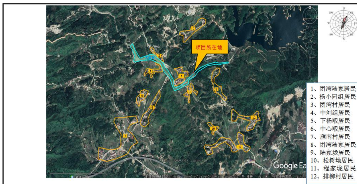
图 3-1 环境保护目标示意图